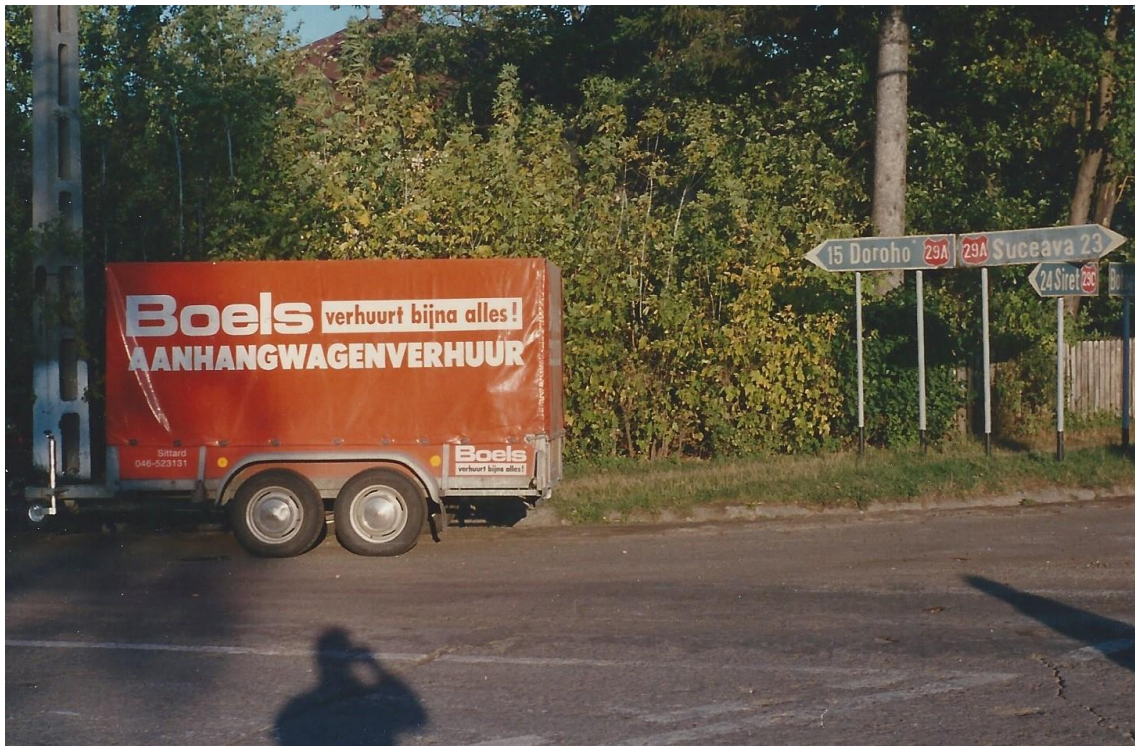
October 1994. Na 4 dagen en 2.000 km is het nog maar 15 km naar Dorohoi

We weten dat deze sponsors onze jaarlijkse verslaglegging zeer waarderen. We hopen dat dit nu weer het geval is. Mocht u willen reageren, graag!