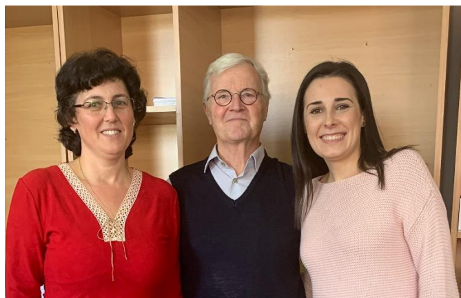
2019 – bezoek aan de Sociale Dienst van de universiteit in Suceava

Terugkijkend op de afgelopen 25 jaar als secretaris kan ik zeggen dat ik al het werk voor de Roemeense studenten met plezier gedaan heb. In het besef dat het alleen mogelijk was dankzij de vele gulle gevers die onze aanpak ondersteunden. En dat de dank voor al die inspanningen verkregen werd in de persoonlijke gesprekken met de studenten, als zij lieten merken hoe waardevol onze hulp en aandacht voor hen was.